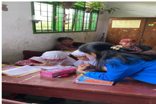
Gambar 2. Siswa Mengerjakan LKPD