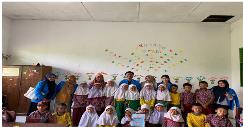
Gambar 3. Foto Bersama Siswa

Selain meningkatkan keaktifan peserta didik, dapat menghemat waktu pembelajaran LKPD juga dapat menjadikann peserta didik yang dapat belajar mandiri. Berdasarkan PKM yang dilakukan dib SD Negeri 200120 Padangsidempuan di kelas IV, LKPD sangat membantu peserta didik dalam belatih belajar mandiri, dikarenakan pada LKPD tersebut sudah ada petunjuk untuk menyelesaikan soal.