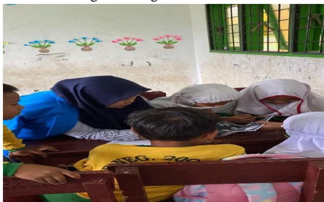
Gambar 1. Menjelaskan Penggunaan LKPD

LKPD dalam proses pembelajaran dapat meningkatkan keaktifan peserta didik dalam proses pembelajaran dimana ketika pendidik membuat LKPD sebagai bahan ajar maka peserta didik akan lebih aktif dikarenakan pada LKPD terdapat perpaduan warna, desain, gambar yang mengakibatkan peserta didik lebih fokus pada pembelajaran (Septiasih, Wardani, & Sumarti, 2022). Berdasarkan kegiatan PKM yang dilakukan memang dapat dilihat bagai mana antusias peserta didik saat mengerjakan soal yang ada pada LKPD tersebut. Selain itu peserta didik juga saling bekerjasama sehingga dapat melatih sikap sosial di antara sesama. Berikut gambar kegiatan.